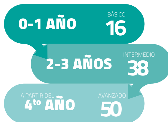
Figura 1. Puntaje máximo esperado por nivel de operación

La Matriz GAGE considera tres niveles de operación de los CA, los cuales, corresponden a las condiciones de operación logradas en función de su estado de consolidación. Para cada nivel hay un máximo de puntuación esperada de acuerdo con los indicadores de la Matriz GAGE: nivel básico (16 puntos), intermedio (38 puntos) y avanzado (50 puntos).